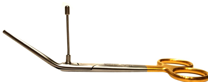
EPISCISSORS-60 med retningsguide